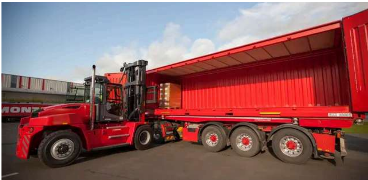
Die Ganzzüge verbinden den Linzer Containerterminal zwei Mal pro Woche mit Duisburg und ein mal die Woche mit Rotterdam.

Die Ganzzüge verbinden den Linzer Containerterminal zwei Mal pro Woche mit Duisburg und ein mal die Woche mit Rotterdam, zusätzlich gibt es tägliche Antennen-Verkehre von und nach Kapfenberg, Wien Süd und Villach Süd, mit denen Waren in die Ganzzüge eingespeist werden können. Jeder Rundlauf verfügt über 19xVier-Achs-Containertraggwagen, die je 38x 30 ft-Stellplätze für die firmeneigene "Moco" (Montan Container)-Flotte anbieten können.