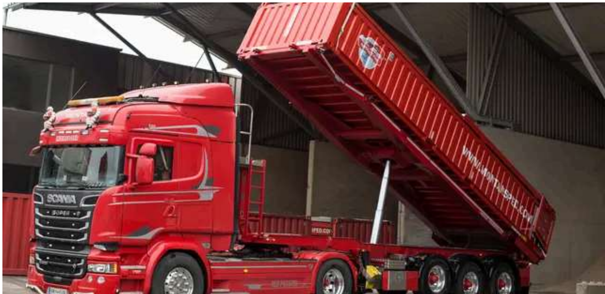
Zum Einsatz kommen dabei die firmeneigenen MOCO (MOnTan Container).

Die neue multimodale Verbindung richtet sich vor allem an Unternehmen der Schwer-, Recycling- und Montangüterindustrie, die Schüttgüter, kranbare Waren oder schwere Palettenwaren versenden. Die kombinierten MOCO-Verkehre sparen 80 Prozent CO 2 im Vergleich zu reinen Straßenverkehren ein und ermöglichen eine sehr einfache Umstellung von der Straße auf die umweltfreundliche Schiene.