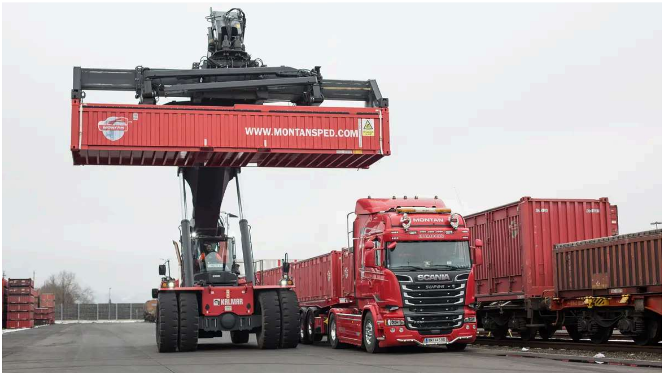
Völlig neue Möglichkeiten für den Güterverkehr ergeben sich durch eine neue multimodale Bahnverbindung in den Westen.

Mit einer multimodalen Direktverbindung in die Häfen von Rotterdam und Duisburg geht die Montan Spedition GmbH Kapfenberg seit Jahresbeginn völlig neue Wege. Mehrmals wöchentlich werden die Verbindungen genutzt.