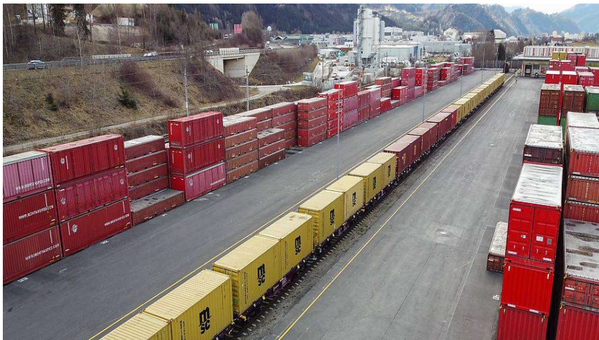
Foto: Maili/RHI Magnesita/Innofreight/MSC Foto: Maili/RHI Magnesita/Innofreight/MSC